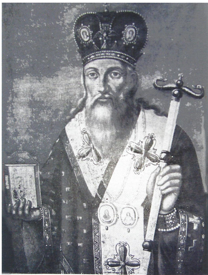
‘Ο Πατριάρχης Κων/πόλεως Μελέτιος Β’ (1768)

Ο Μελέτιος καταρχάς έγινε ιερομόναχος αναλαμβάνοντας καθήκοντα πρωτοσύγκελλου του μητροπολίτη Νικομήδειας Γαβριήλ. Έτσι απέκτησε μεγάλη εμπειρία