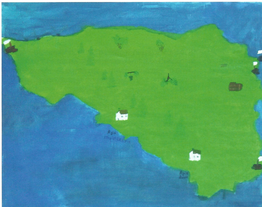
◀ Η Τένεδος

Επειδή μου αρέσει η ζωγραφική άρχισα να ζωγραφίζω την Ίμβρο, που είναι το νησί του πατέρα μου. Όταν την τελείωσα, θέλησα να κάνω άλλο ένα νησί και σκέφτηκα την όμορφη Τένεδο, που είναι το νησί της μητέρας μου. Αυτά τα δυο νησιά είναι τα πιο όμορφα για μένα.