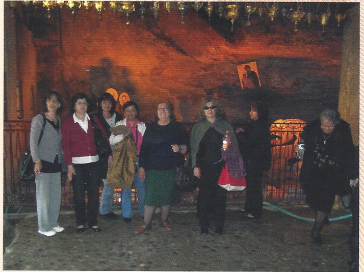
▲ Από την επίσκεψη στη Μονή Μεγάλου Σπηλαίου