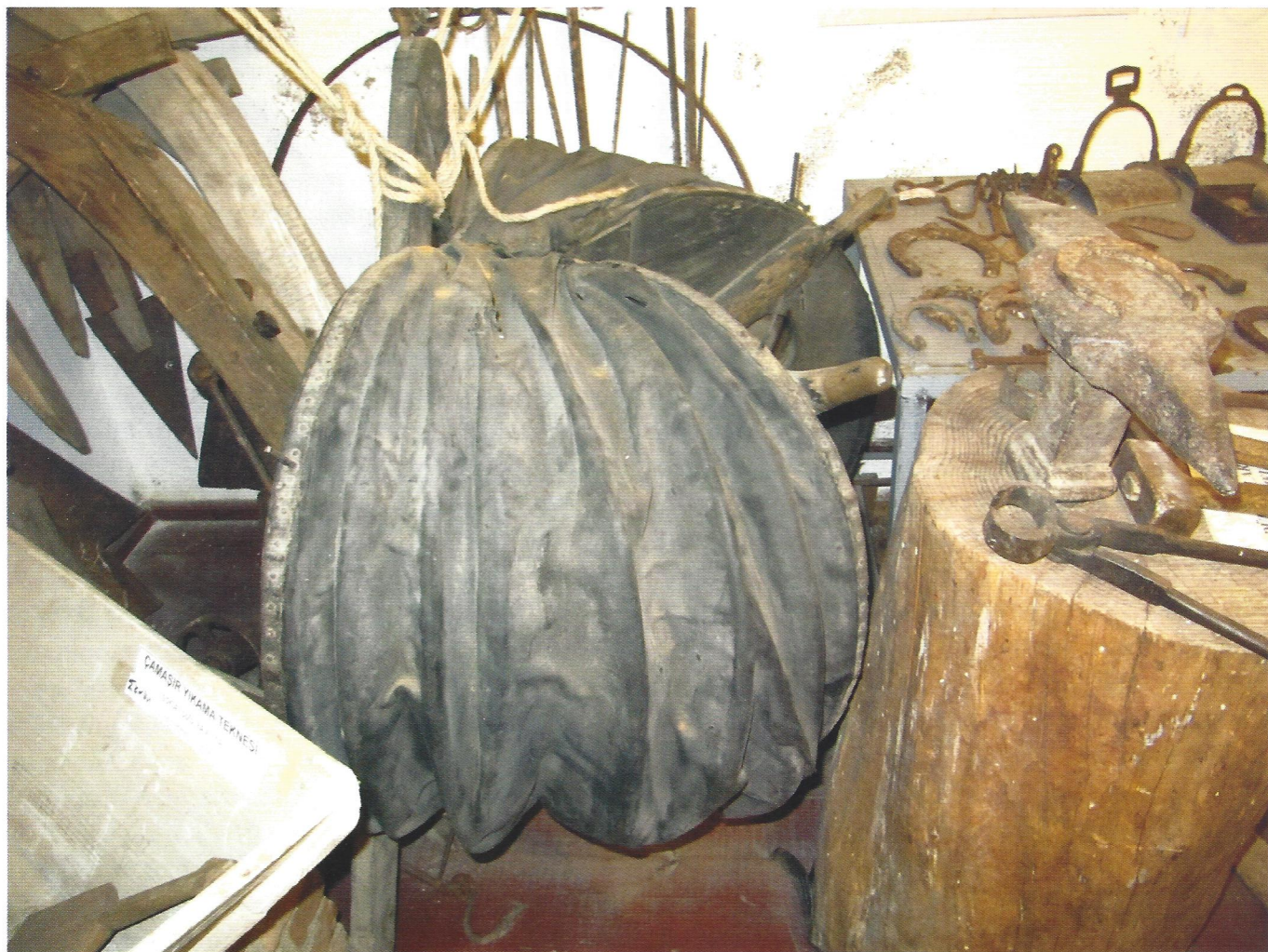
▲ Διάφορα εργαλεία σιδερά: μ'χαν' (στο κέντρο, μοιάζει σαν ακορντεόν), αμόνι (δεξιά), πέταλα κ.ά. (Τοπικό Μουσείο Ιστορίας Τενέδου)

γαζάρα. Η τέχνη του σιδερά ήταν δύσκολη, κοπιαστική και ανθυγιεινή. Όλη την ημέρα πάνω από τη φωτιά. Στο καμίνι έκαιγε το κάρβουνο. Ο βοηθός τραβούσε το μ'χαν' (φυσερό) για να δυναμώνει τη φωτιά. Ο μάστορας κρατούσε με τσιμπίδες το σίδερο πάνω από τη φωτιά, μέχρι να βράσει, να μαλακώσει και μετά να το χτυπήσει πάνω στο αμόνι με τη βαριά για να του δώσει το σχήμα που ήθελε ή να το συγκολλήσει με άλλο βρασμένο σίδερο