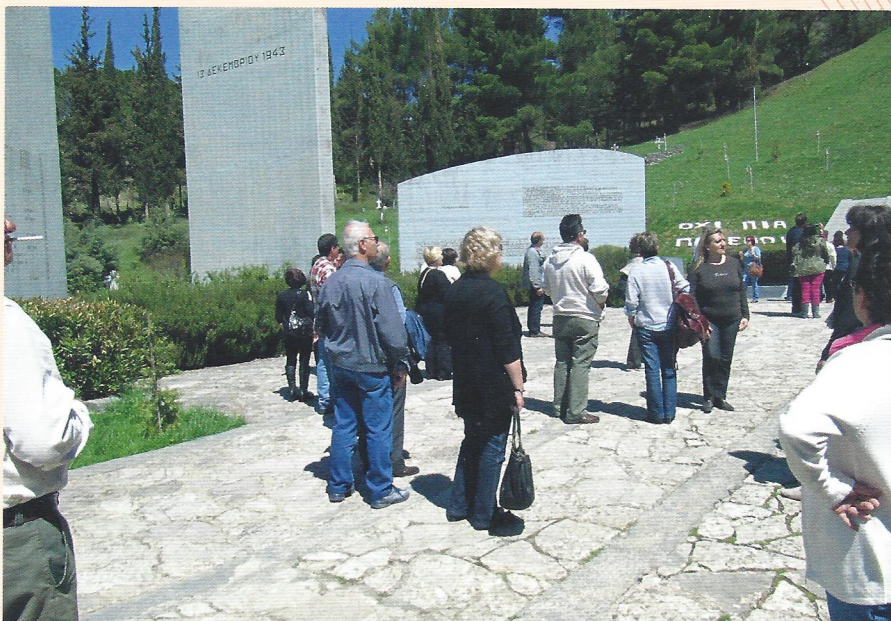
◀ Από την επίσκεψη στον τόπο της θυσίας των Καλαβρύτων