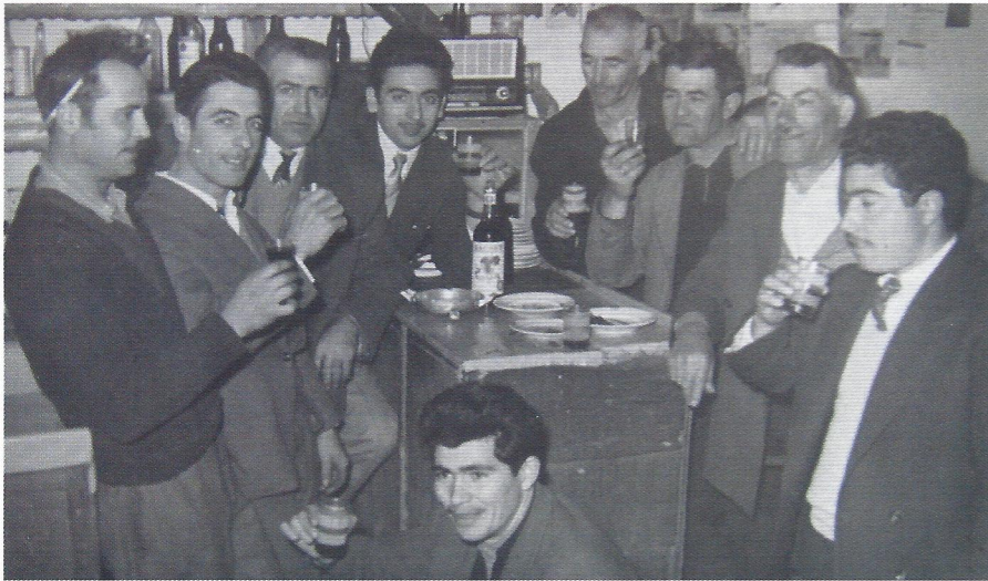
▲ (Αρχείο Κώστα Ιμβριώτη)