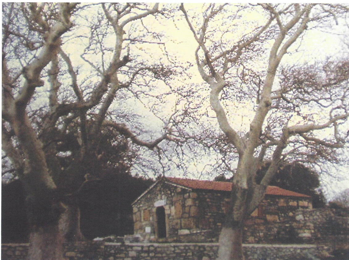
► Η Αγ. Παρασκευή μετά την ανακαίνιση

Τα εξωκλήσια της Τένεδου ανακαινίζονται ή επισκευάζονται. Μέχρι σήμερα έχουν ανακαινισθεί η Αγία Παρασκευή, το Αγίασμα και τα γειτονικά κτήρια, καθώς και ο Άγιος Θεόδωρος και η Αγία Αικατερίνη.