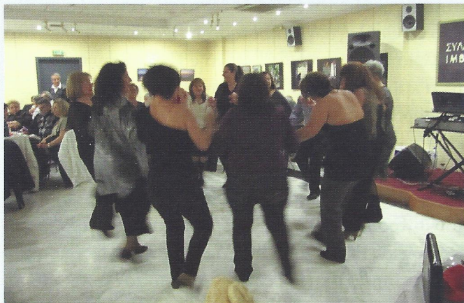
▲ Οι Τενεδιές χορεύουν