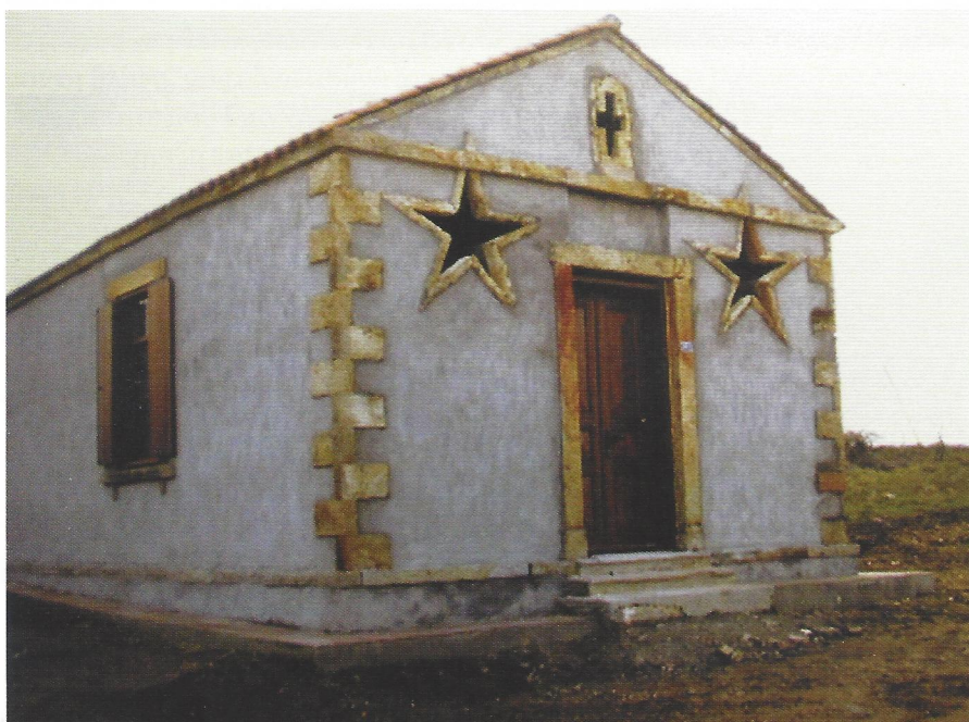
▲ Ο Άγ. Θεόδωρος