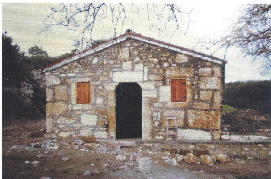
► Η Αγ. Παρασκευή-πρόσοψη