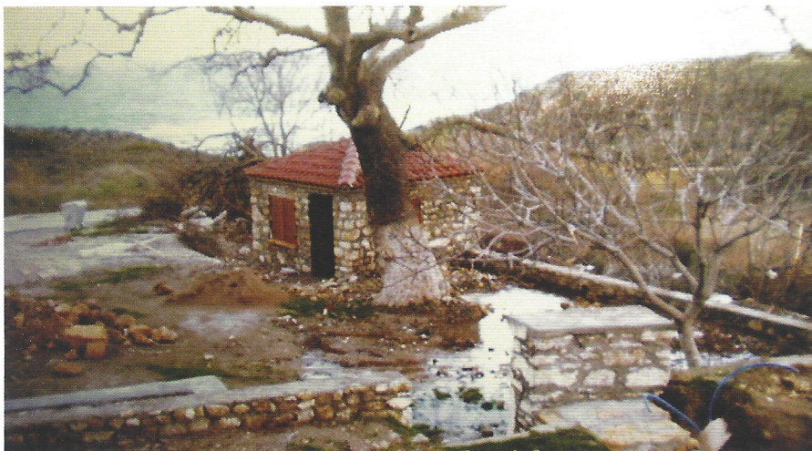
▲ Αγ. Παρασκευή-το καφενείο