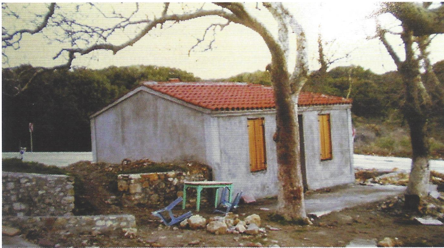
▲ Αγ. Παρασκευή-η «κούλα»