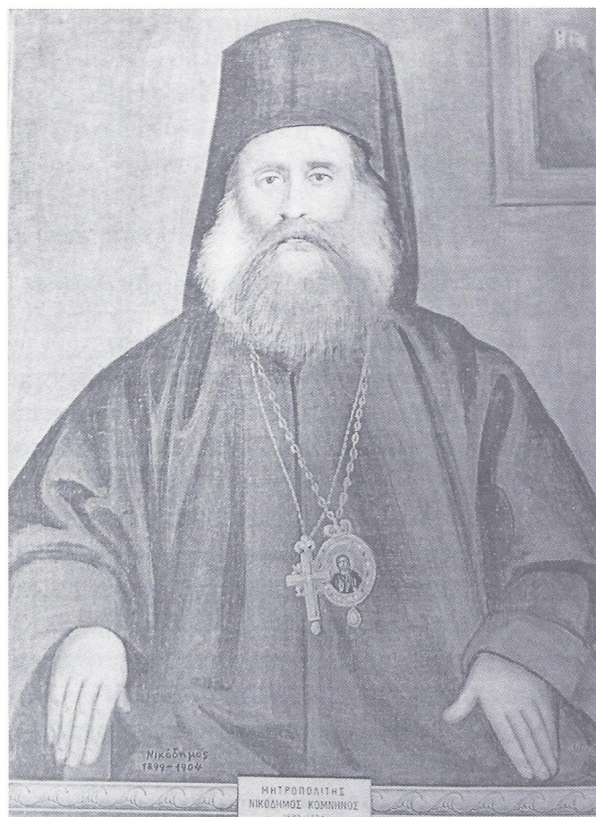
▲ Ο μητροπολίτης Νικόδημος Κομνηνός

ματα αυτά κηλίδωσαν τον κληρικό όχι όμως και τον άνθρωπο και κυρίως το εθνικό του φρόνημα. 16 Τελικά ο Νικόδημος αναχώρησε για την Έδεσσα στις αρχές Ιουνίου 1899. 17