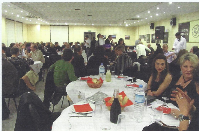
▲ Άποψη από την εκδήλωση