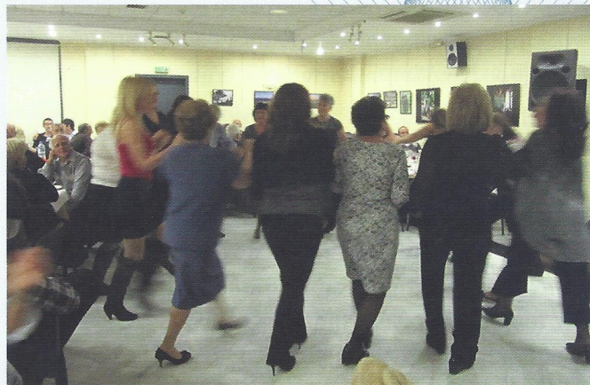
▲ Οι Τενεδιές χορεύουν